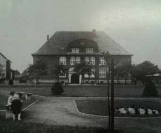
Seit 2010 ist die Grafschaft Moers in der ehemaligen Wilhelmschule zu finden. Hier ein Bild der Schule aus dem Jahr 1925.

Die erste Geschäftsstelle der Grafschaft Moers befand sich tatsächlich in der Stadt Moers. Auch wenn der Name etwas anderes vermuten lässt: Eigentlich hat dieser nichts mit der Stadt Moers zu tun