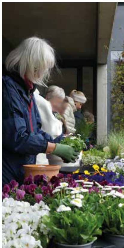
Auch diese besondere Außenanlage (rechts) erhielt eine neue Bepflanzung

Ende März haben wir die Bewohnerinnen und Bewohner der Fasanenstraße in Kamp-Lintfort und der Parkstraße in Sonsbeck dazu eingeladen mit uns gemeinsam die Balkone und Terrassen zu bepflanzen.